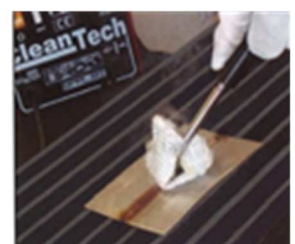
Reinigen der Schweißnaht