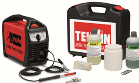
Reinigen der Schweißnaht