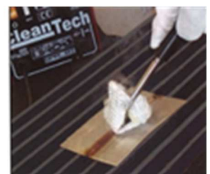
Reinigen der Schweißnaht