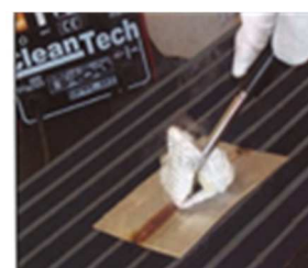
Reinigen der Schweißnaht